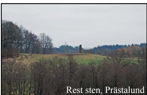
Rest sten, Prästalund