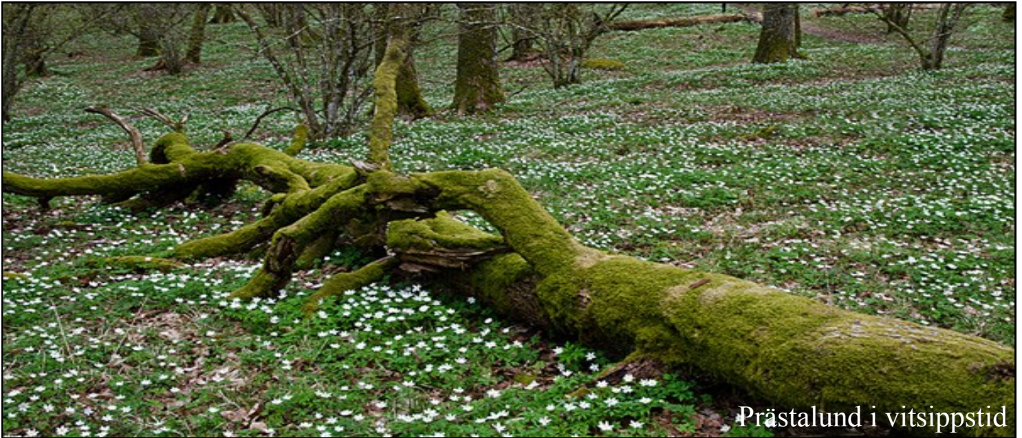
Prästalund i vitsippstid

Från Jennylund följer den alternativa leden Vättlefällsleden längs Jennylunds elljusspår, runt Stora Mettjärn och vidare mot OK Alehofs klubbstuga, Dammekärr. I Stora Mettjärn, som är en av traktens bästa badsjöar, kan vandraren ta ett uppfriskande bad och samtidigt njuta av den vackra klockgentianan, som förekommer rikligt runt sjön. Vid Dammekärr ges tillfälle till dusch och fika. Öppettider: se länk ok.alehof.se Vid Lindåsen, där vägen passerar ån, finns stora chanser att få se den rara forsärulan.