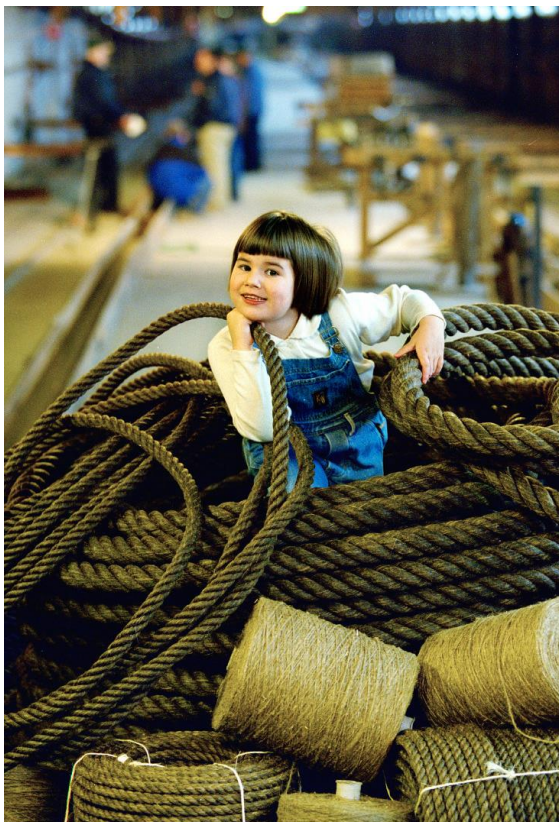
Bild ur en av Carlmarks broschyrer

Museet är ett levande arbetslivsmuseum. Vid visningar kan tillverkning av rep ingå i programmet. Här är det tre dukter som passerar skallen och blir en tross. En kraftkälla utanför höger bildkant får trossen att rotera. Släden med skallen flyttar sig sakta åt vänster. Bild från Repslagarmuseet 2012.