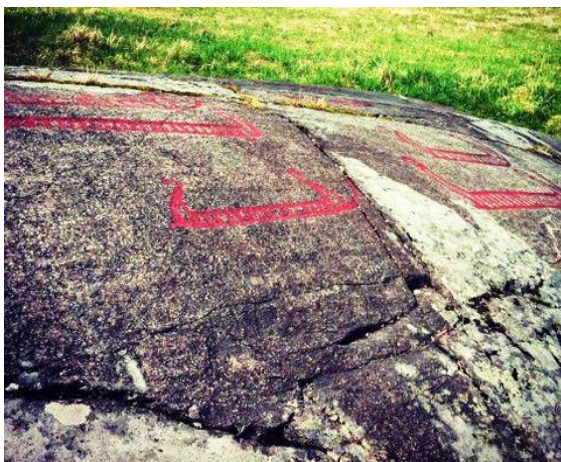
Del av hällristningarna vid Jätteberget Foto: Ale kommun.

*Cappels kyrka är idag en grop vars historia inte är klarlagd. På en karta från 1600-talet finns en kyrka upptagen. Även namnet Cappels socken förekommer.